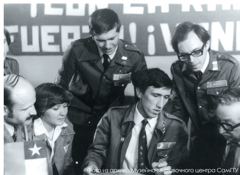
Бойцы отряда «Венсеремос» («Мы победим») встретились с лидером чилийских коммунистов Луисом Корваланом в стенах родного вуза.

Особенно известным был созданный в 1976 году коммунистический строительный отряд «Венсеремос», первым командиром которого являлся заместитель секретаря ко-