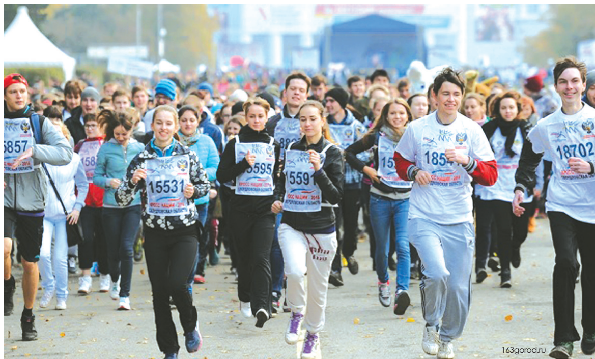
«Кросс нации» стал традиционным легкоатлетическим соревнованием.

г. Самара, ул. Молодогвардейская, 244, корпус № 1а Тел.: (846)278-43-76, 278-43-75