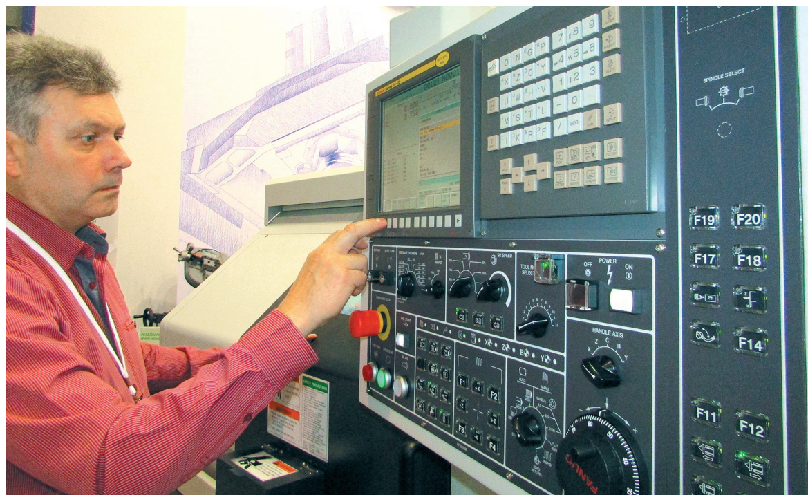
На выставке было представлено передовое оборудование.

«Промышленный салон – 2015» обозначил проблемы отрасли