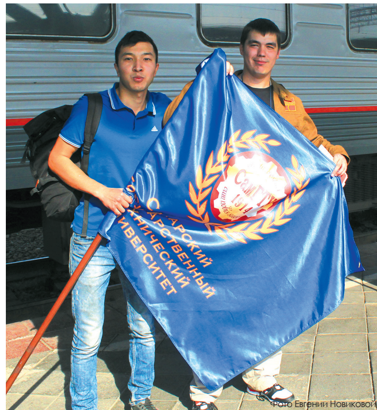
Флаг СамГТУ участники стройотряда взяли с собой на Дальний Восток.